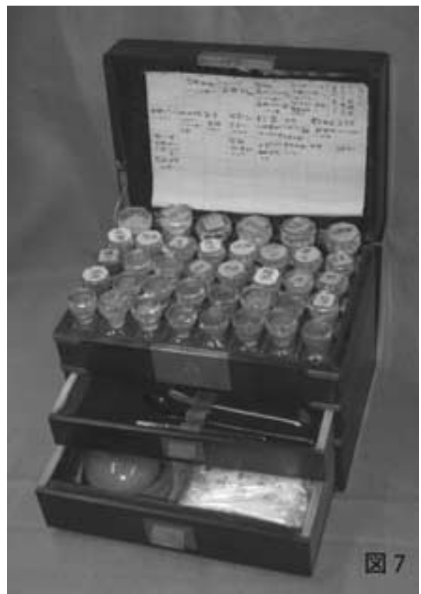
本荘鈴平医学等資料中の医療器具の一部 図1は瀉血器、図2は截丸器、図7は薬箱、他は用途や名称不明 (大きさなど詳細は本文参照)