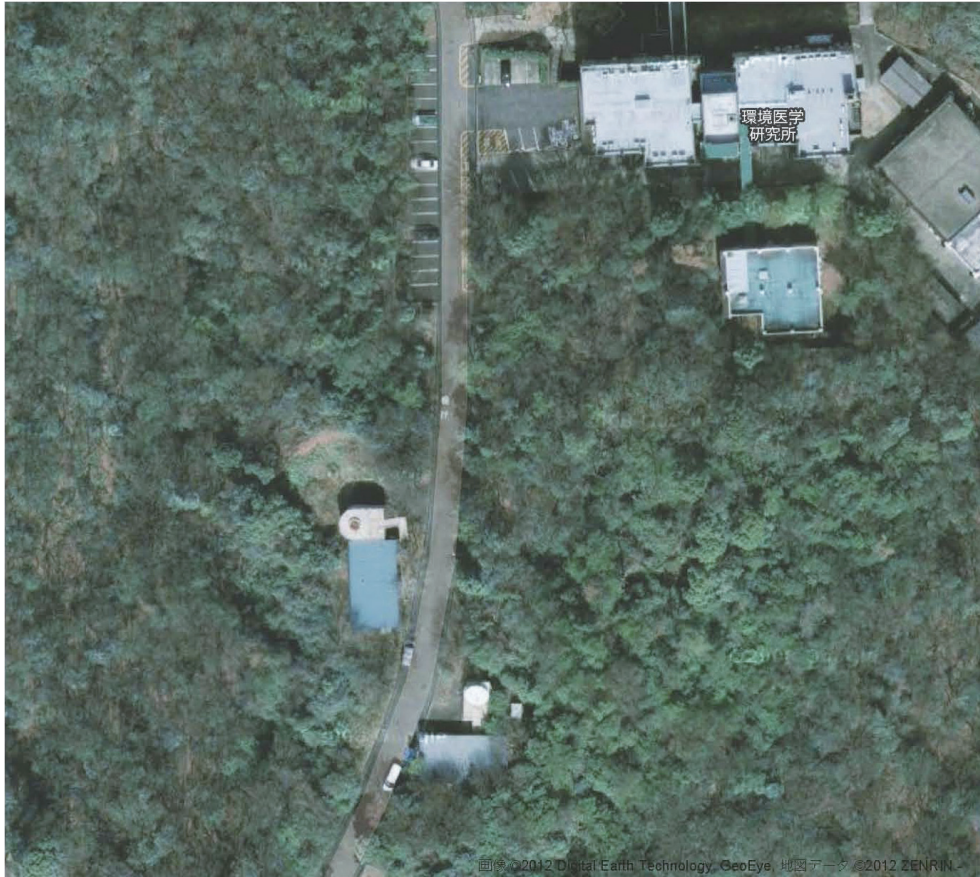
図 4. 電波望遠鏡の基台部分が撤去される以前のポイント A の航空写真。この時点では、ナショナルコンポジットセンターの建設とそのため仮設工事事務所の設置もまだ始まっていない（写真は 2012 年 10 月 1 日時点での Google マップから）。