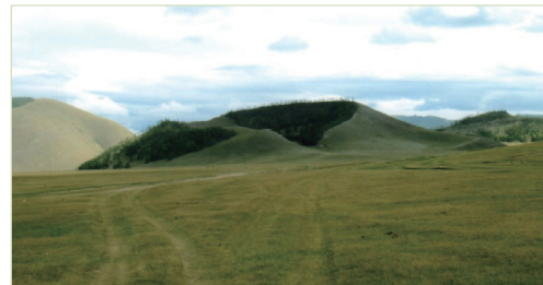
モンゴル北部の火山円錐丘

9月16日には、アムール河岸の岩が砂岩(原文ではサンドストーン)または礫岩(原文ではコングロメラート)でできていると書いている。9月20日には、ヒルガン峡で望遠鏡を通して見た岩が砂岩(原文ではサンドストーン)および粘板岩(原文ではクレイスレート)に似ているが、花崗岩(原文ではガラニート)や玄武岩(原文ではバザルト)や溶岩(原文ではラハ)は見かけないと書いている。