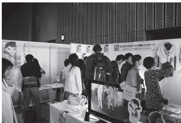
図2 サイエンスアゴラ出展企画のもよう。3×4mのブースである。手前の大型モニタは赤外線カメラで通路を映している。右奥は布製品をポータブルデバイスで観察している。中央奥は赤外線透過実験で絵画を観察している。左奥の受付で参加者のカメラ付き携帯電話に赤外線透過フィルタを装着している。

これまで継続して実施しているハンズオン型の企画である「触れて感じて学ぶ！サイエンス」の一環として、赤外線および紫外線の性質を活用した「見えない世界が見える場所！？～触れて感じる！ポケットミュージアム～」『目には見えない』ものばかり！？ ふしぎな雑貨店、ただいまオープン！』をそれぞれ名古屋大学ホームカミングデイおよびサイエンスアゴラ2012において実施した。前者は小型のミュージアムを、後者は雑貨店を模して内装を施している。それぞれの参加者数は約150名および300名程度である。図2にサイエンスアゴラ2012での出展ブースの様態を示す。以下に各ブースおよび赤外線観察デバイスの概要を述べる。