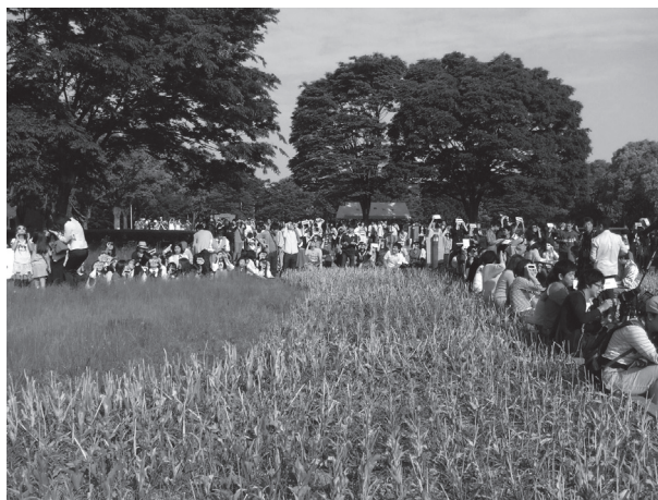
図1 金環日食観望会時の会場のもよう。太陽の方向は右斜め後方。多くの参加者が花壇の縁に座って観察している。奥のテントは3Dシミュレーション等のブースである。